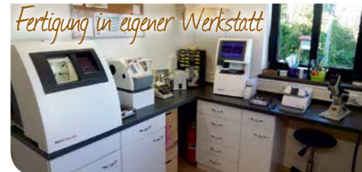
Fertigung in eigener Werkstatt

In unserer betriebseigenen Werkstatt fertigen wir alle Brillen selbst. Getreu dem Motto: